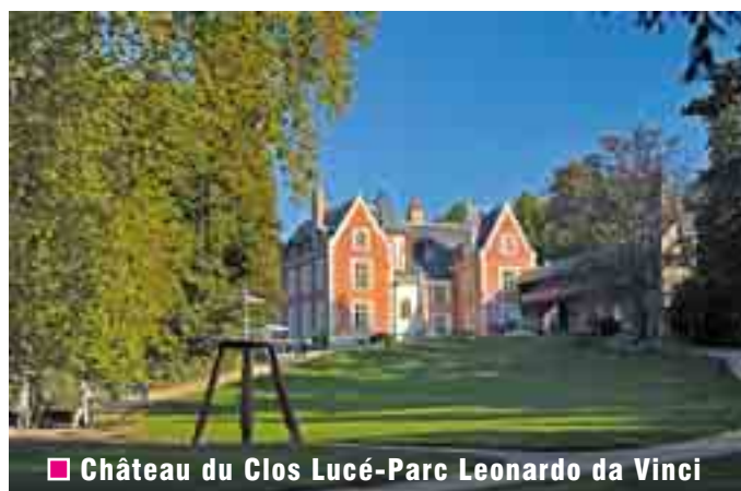
■ Château du Clos Lucé-Parc Leonardo da Vinci